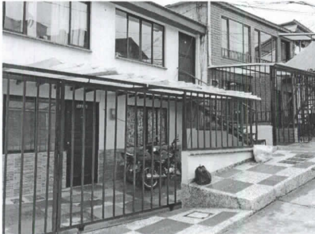
Foto No 6. Escaleras, cerramiento y cubierta sobre antejardín.