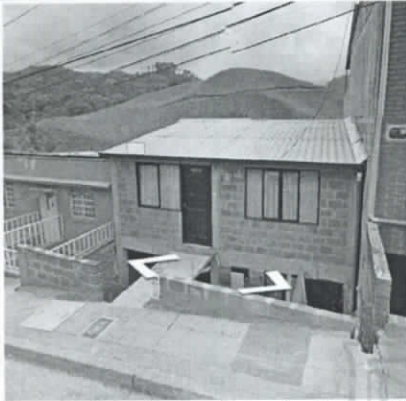
Foto No 1. Tomado del aplicativo Consulta Cartográfico Temática POT Urbano 2017-2031 Google Street Noviembre 2.012.