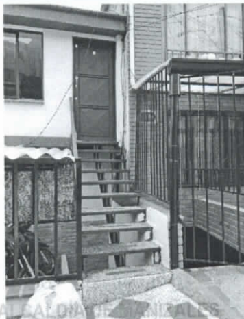
Foto No 4. Escaleras, cerramiento y cubierta sobre antejardín