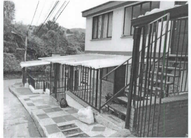
Foto No 7. Entorno.