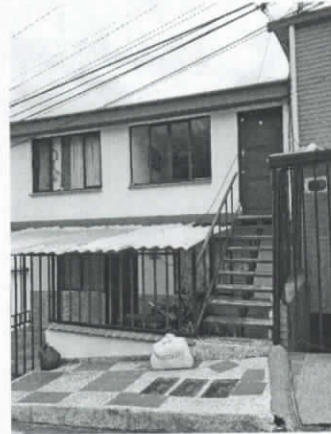
Foto No 2. Fachada actual del predio ubicado en la calle 63ª No.9B-61