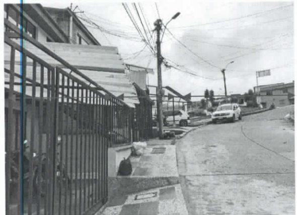
Foto No 5. Perfil de vía visto en sitio, antejardín 3,00 m, andén 1,30 m y calzada 6,00 m.