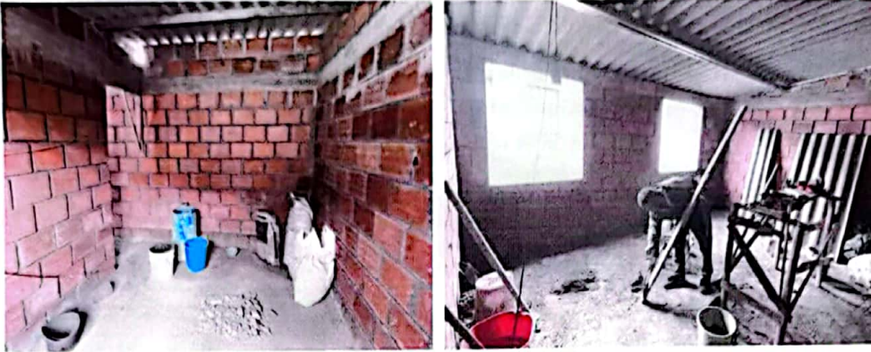
Foto No 3. Construcción del segundo piso en sistema de pórticos (vigas y columnas) y muros en mampostería, adicional se tiene personal de obra sin los debidos elementos de protección y material al interior del inmueble.