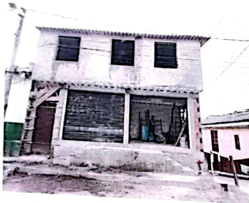
Foto No 1. Fachada del inmueble ubicado en la CARRERA 15 No. 24-60/64 con CALLE 25 No. 15-08 .