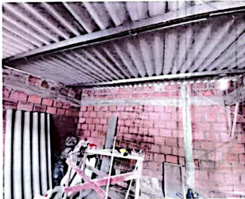
Foto No 4. Cubierta en teja de fibrocemento apoyada en perfilería metálica.