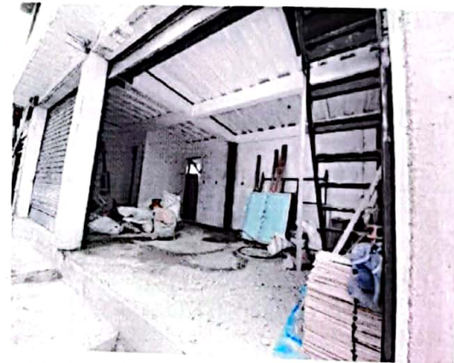
Foto No 2. Construcción del primer piso, y losa de entrepiso fundida en concreto sobre steel deck.