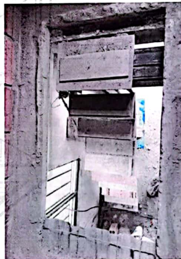
Foto No 5. Escalera metálica con huellas fundidas en concreto, que conecta el primero con el segundo nivel.