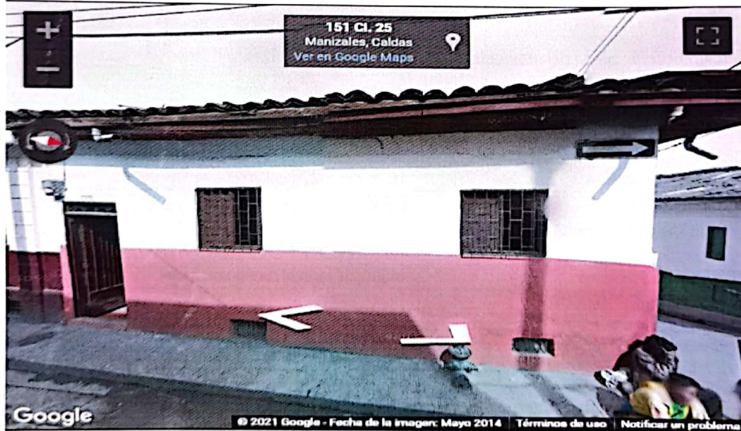
IMAGEN No 2. Imagen tomada por Google Street view, Mayo 2014, inmueble ubicado en la dirección CARRERA 15 No. 24-60/64 con CALLE 25 No. 15-08