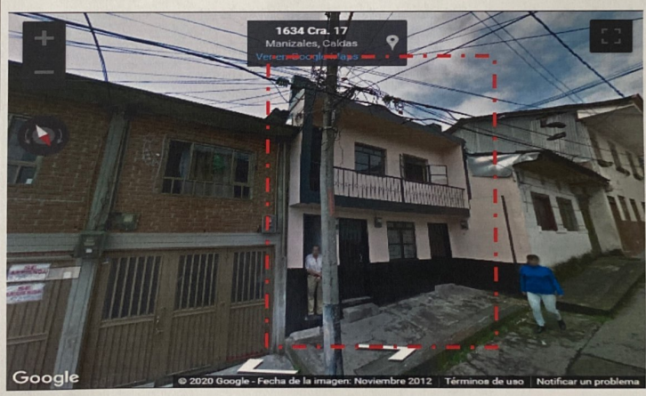
IMAGEN No 2. Imagen tomada por Google Street view, Noviembre 2012, inmueble ubicado en la direcciones CARRERA 17 No. 16-28/32.