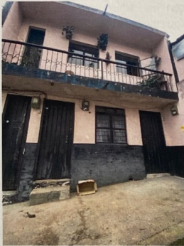
Foto No 1. Fachada del inmueble ubicado en la Carrera 17 No. 16-28/32.