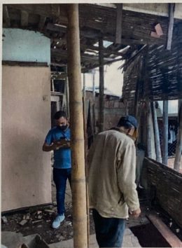
Foto No 3. Personal de obra, mal estado del interior del inmueble, estructura en bahareque.