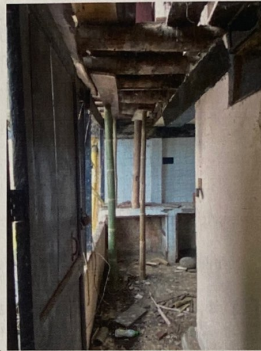
Foto No 2. Apuntalamiento al interior del inmueble con guadua para controlar el colapso de la cubierta.