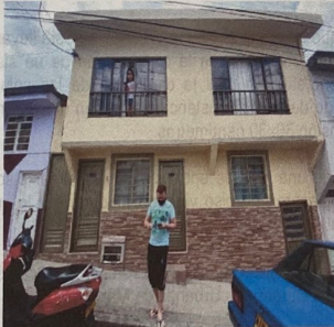
Foto No. 1 Fachada de la vivienda.