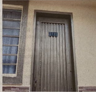
Foto No. 2. Nomenclatura del predio.