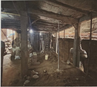
Foto No. 3. Se aprecia el la construccion en sistema aporticado en proceso.