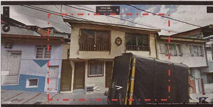
IMAGEN No2. Imagen tomada por Google Street View, diciembre de 2012, Dirección Calle 36A No 27-37.