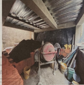
Foto No. 4. Herramientas, materiales de construccion y detalle de la losa de entpiso en sistema metaldeck.