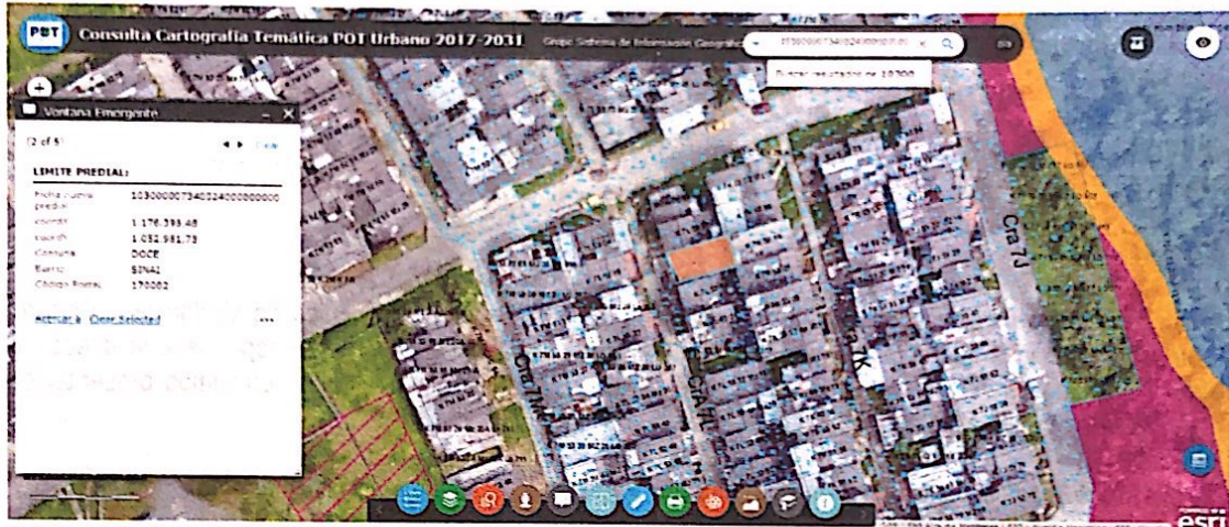
IMAGEN No1. Barrio Sinaí, Comuna Ciudadela del Norte. Imagen cartográfica. Consulta Sistema Estructurante - Sistema de Información Geográfica – SIG.