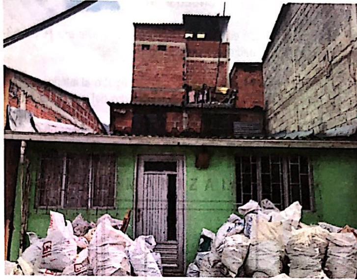
Foto No. 1 Fachada de la vivienda.