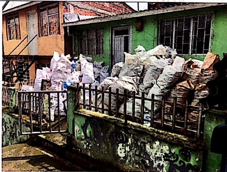
Foto No. 3 Se evidencio bultos de material y residuos de construcción sobre el antejardín de la vivienda