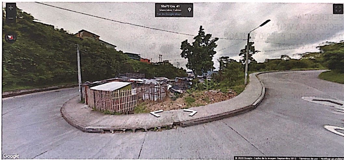
Imagen tomada por Google Street View, septiembre 2013, fachada de la vivienda Calle 55 39G-02 Barrio Camilo Torres

ALCALDÍA DE MANIZALES Calle 19 N° 21-44 Propiedad Horizontal CAM Teléfono 887 97 00 ext.71500 – Código postal 170001 – Atención al Cliente 018000 968988 www.manizales.gov.co