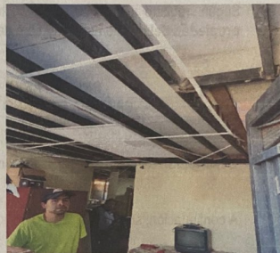
Foto No 2. Detalle de la losa de entrepiso con vigas metálicas y placa de fibrocemento.