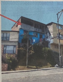
Foto No. 1 Fachada principal de la vivienda, se visualiza la construcción del tercer piso.