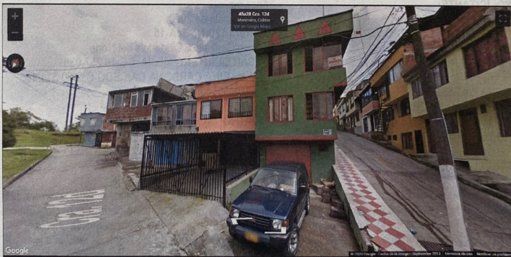
Vista fachada principal, de vivienda preexistente en predio en cuestión, Carrera 12D No 54A-15. – Imagen tomada en Septiembre de 2013 por Google Street View.