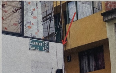
Foto No. 4 Nomenclatura de la esquina del predio..