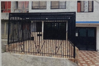
Foto No. 3 Se observa el cerramiento en reja metálica cubierto y el endurecimiento, todo esto en la zona del antejardín.