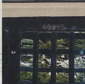
Foto No. 2 Nomenclatura del predio.