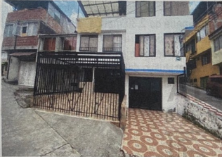
Foto No. 1 Fachada del predio ubicado en Carrera 12D No. 54A-15 , en barrio Fanny González, Comuna Ciudadela del Norte.