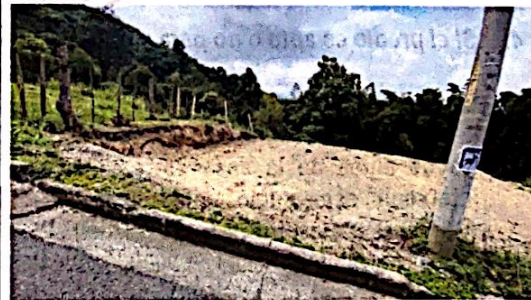
Foto No. 2 Movimiento de tierras en proceso.