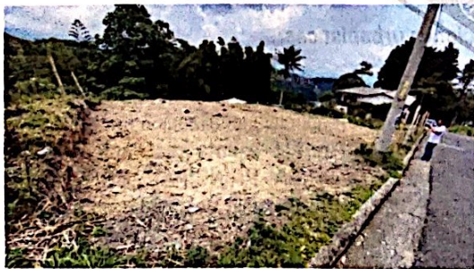
Foto No. 1 Movimiento de tierras en proceso.