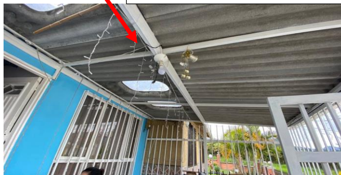
Foto No. 3 Vista fachada, endurecimiento del área de la zona verde, cerramiento perimetral con estructura metálica y cubierta en teja de fibrocemento No abatible.

Cubierta No abatible en estructura metálica y teja en fibrocemento.