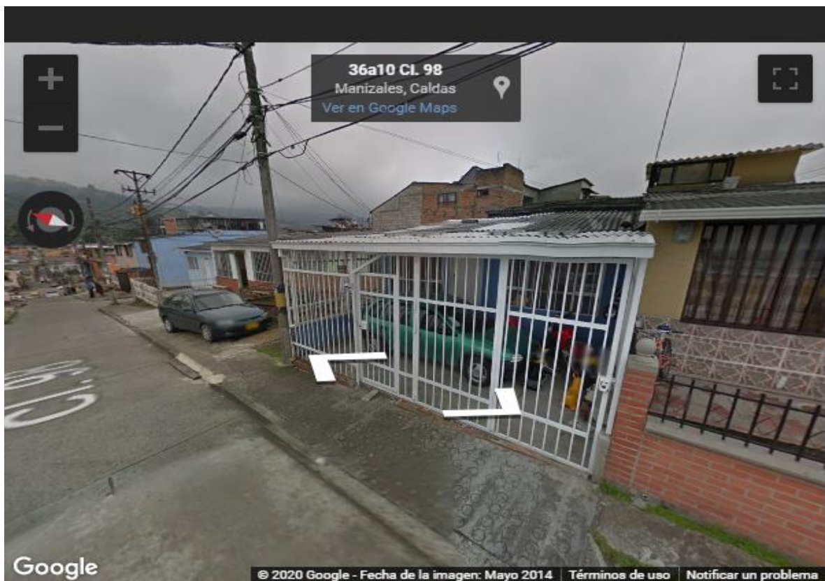
Imagen tomada de Google Street View Mayo 2014, acceso al lote de invasión.