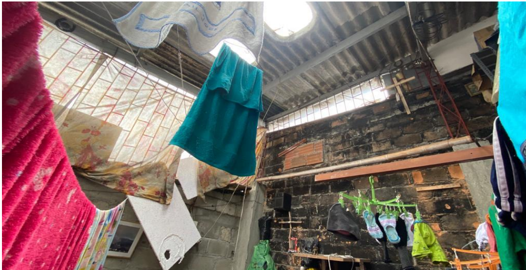
Foto No. 2 Se evidencia que No se han empezado labores de construcción en la vivienda ubicada en la Calle 98 No. 36A-21 la Enea.