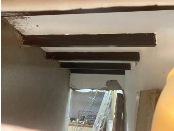
Foto No. 1 Se observa evidencia de material de construcción dentro de la vivienda y demolición de muros