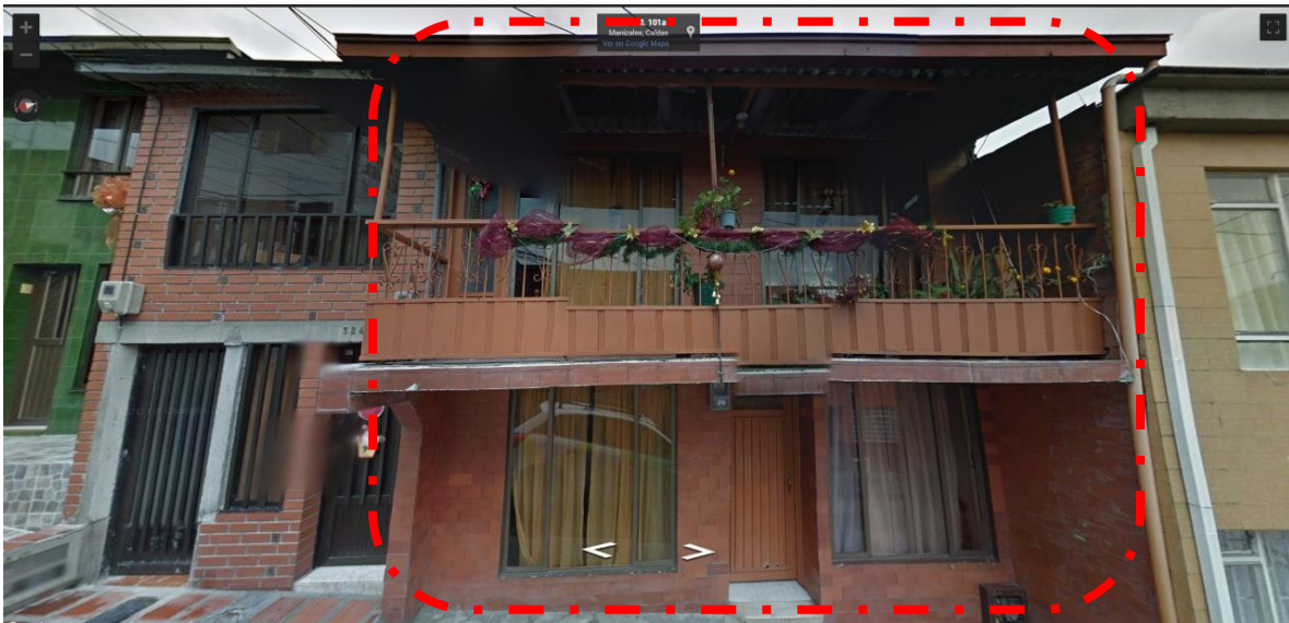
Imagen tomada por Google Street View, Diciembre de 2012, fachada de la vivienda calle 101 A # 32 A 55