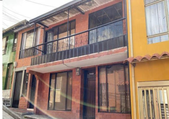
Foto No. 2 En la visita se pudo evidenciar que no se observan vallas informativas sobre permisos expedidos por curadurías urbanas de Manizales