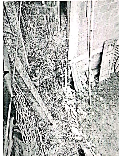
Imagen 2. Vista general del talud en la parte posterior.