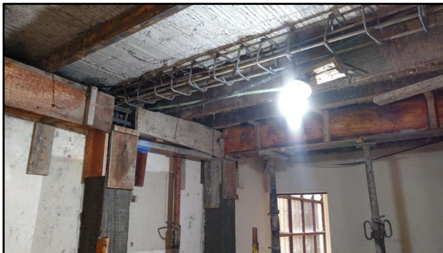
Imagen 2. Vigas y columnas al interior de la vivienda afectada.