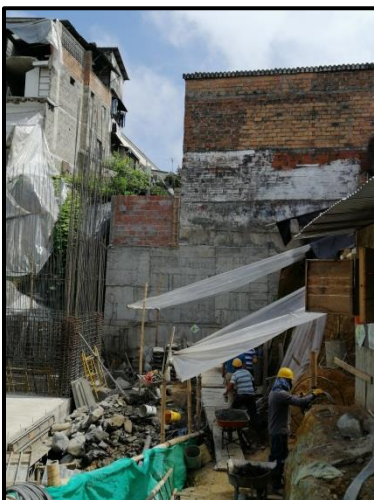
Imagen 1. Pantalla y muro actual.