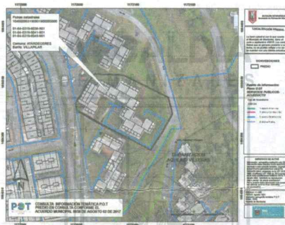
Imagen N° 2. Localización del lote en el cual se encuentra la edificación que contiene los tres (3) inmuebles consultados, en el contexto del Plano U-23.

En las imágenes N° 2 y N° 3 se ilustra la localización del lote en el cual se encuentra la edificación que contiene los tres (3) inmuebles consultados, en el contexto de los Planos U-23 y U-24, respectivamente.