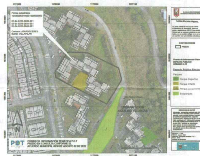
Imagen N° 4. Localización del lote en el cual se encuentra la edificación que contiene los tres (3) inmuebles consultados, en el contexto del Plano U-10.

En la imagen N° 4, se ilustra la localización del lote en el que se ubica la edificación en la que se encuentran los tres (3) inmuebles consultados, en el contexto del Plano U-10.