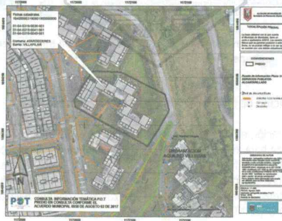
Imagen N° 3. Localización del lote en el cual se encuentra la edificación que contiene los tres (3) inmuebles consultados, en el contexto del Plano U-24.