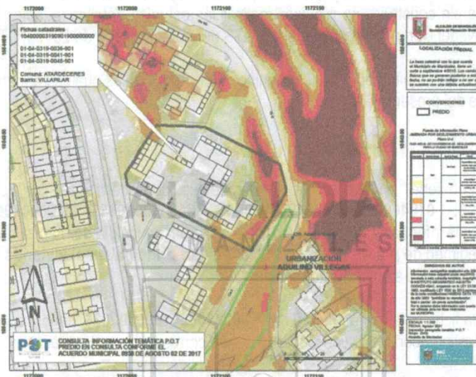
Imagen N° 5. Localización del lote en el cual se encuentra la edificación que contiene los tres (3) inmuebles consultados, en el contexto del Plano U-4

SPM 2813 -2021 Manizales, 26 de agosto de 2021