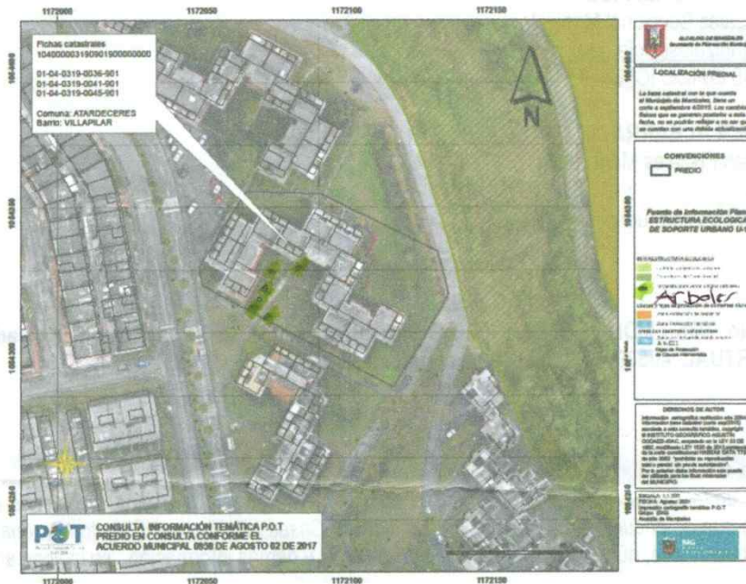
Imagen N° 1. Localización del lote en el cual se encuentra la edificación que contiene los tres (3) inmuebles consultados, en el contexto del Plano U-1.

SPM 2813 -2021 Manizales, 26 de agosto de 2021