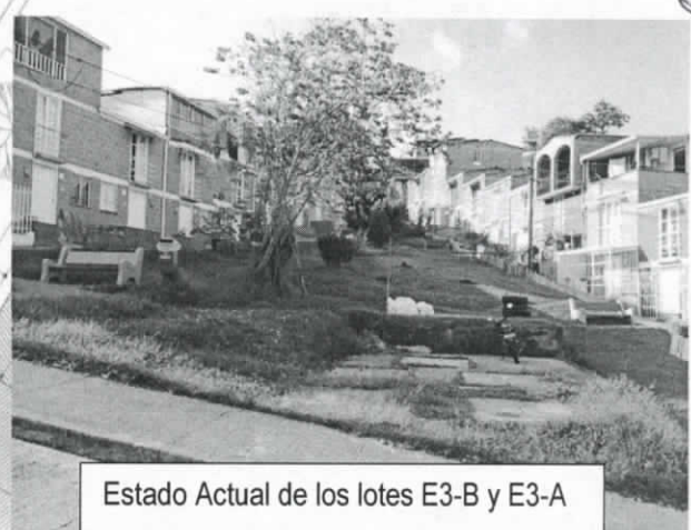
Estado Actual de los lotes E3-B y E3-A

Lotes E3-B y E3-A objeto de análisis. Predios Particulares que no hacen parte de las Áreas de Cesión obligatorias.