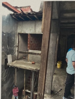
Foto No. 5. Detalle de las modificaciones a la vivienda preexistente y además personal laborando.

SGM VC 1148-2020 Manizales, noviembre 19 de 2020