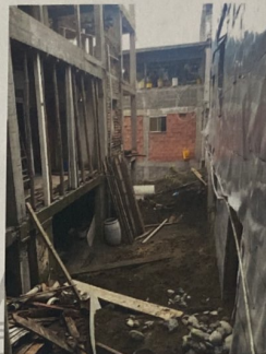
Foto No. 6. Imagen de la construcción, materiales, y escombros.