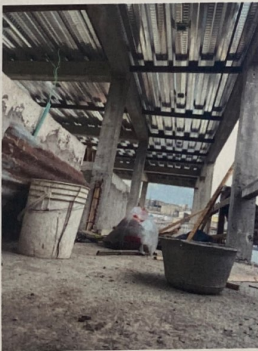
Foto No. 3. Detalle de la estructura aporticada y las losas de entepiso en sistema steel deck.