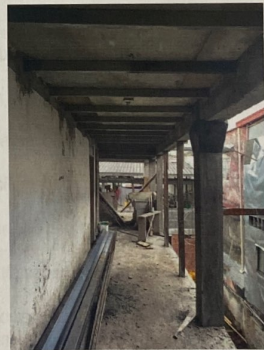
Foto No. 4. Detalle interno de la construcción, materiales de construcción.