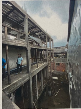
Foto No. 2. Se visualizan los tres niveles de la construcción en curso. Estructura aporticada.