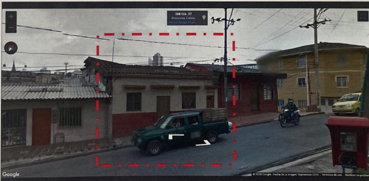
IMAGEN No2. Imagen tomada por Google Street View, septiembre de 2013, Dirección Calle 38 # 27-14.