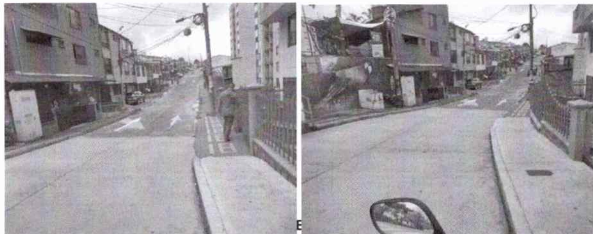
Calle 19 N° 21-44 Propiedad Horizontal CAM

Teléfono 887 97 00 ext.71500 – Código postal 170001 – Atención al Cliente 018000 968988