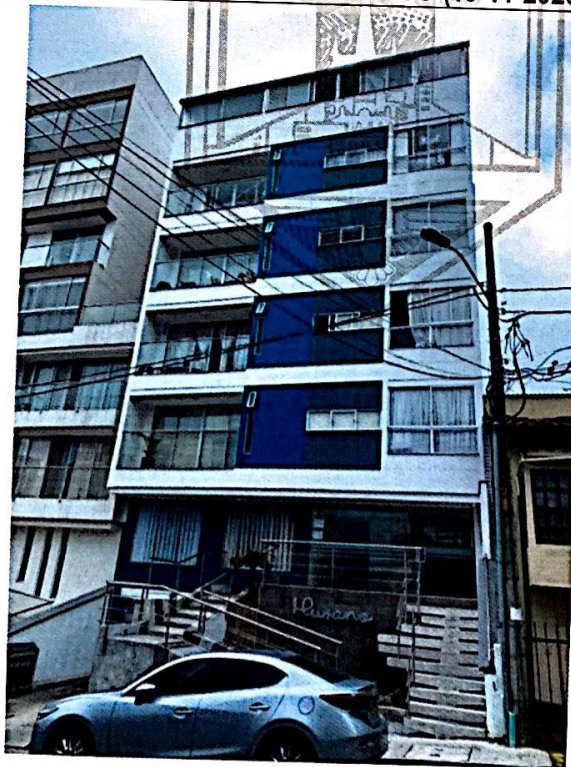
Fotografía No 1. Edificación objeto de la visita.