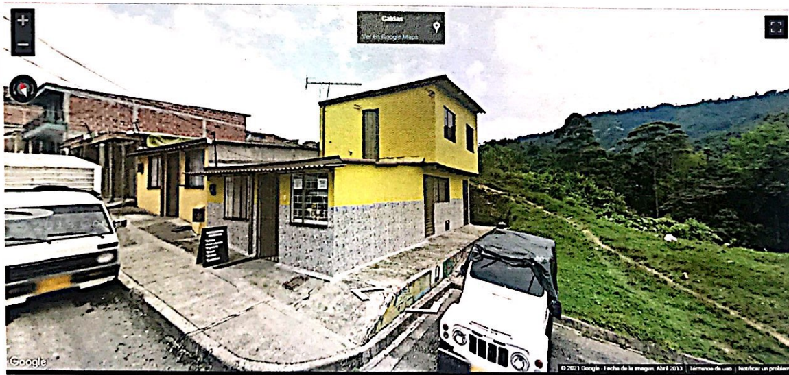
IMAGEN No 2. Imagen tomada por Google Street View, abril de 2013