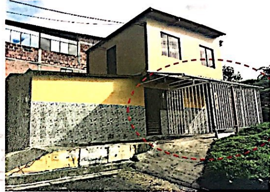
Foto No 2. Fachada lateral de la vivienda con dirección Carrera 3F # 48I-51. Se observa el cerramiento metálico, la cubierta y la rampa de acceso