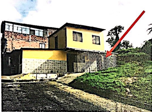
Foto No. 1 Fachada principal de la vivienda con dirección Carrera 3F # 48I-51. Se observa el cerramiento metálico y la cubierta en la parte lateral.