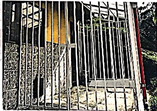
Foto No 4. Detalle del endurecimiento de la zona verde y la invasión del anden