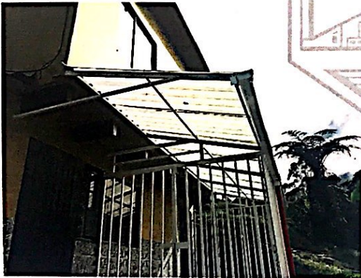
Foto No 3. Detalle del cerramiento metálico y la cubierta en teja de policarbonato