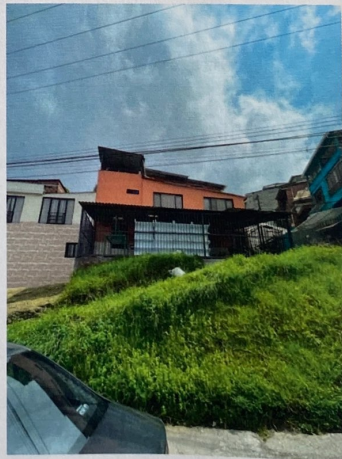
Foto No. 4 Endurecimiento, cerramiento y cubierta sobre Zona Verde.