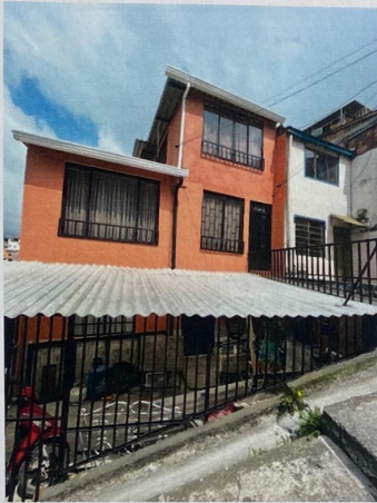
Foto No. 1 Fachada de la vivienda, endurecimiento, cerramiento y cubierta sobre Zona Verde.