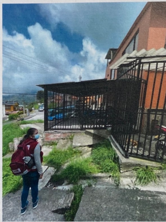
Foto No. 2 Endurecimiento, cerramiento y cubierta sobre Zona Verde.