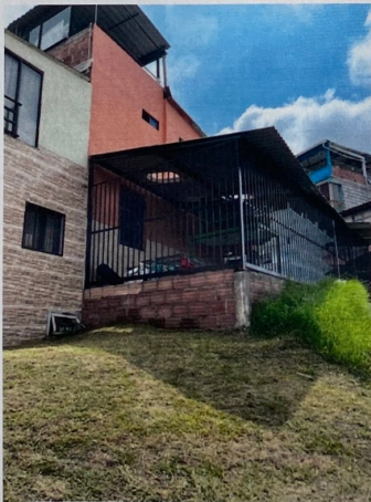
Foto No. 3 Endurecimiento, cerramiento y cubierta sobre Zona Verde.