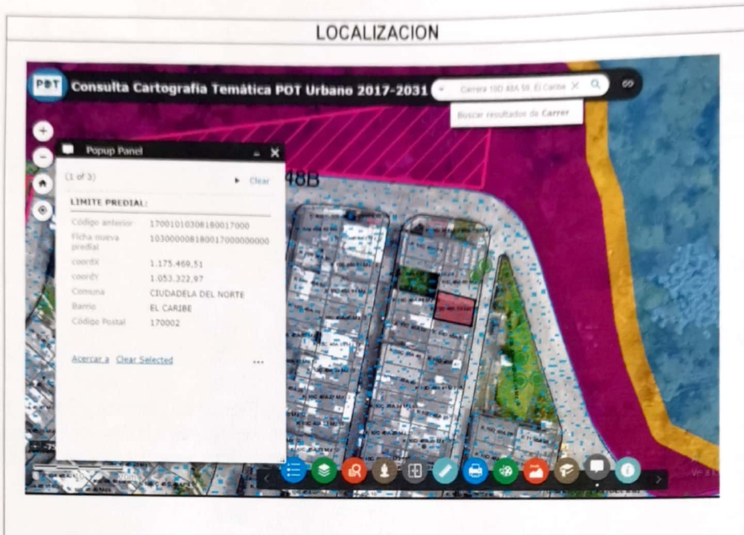
IMAGEN No1. Barrio El Caribe, Comuna Ciudadela del Norte. Imagen cartográfica. Consulta Sistema Estructurante - Sistema de Información Geográfica – SIG.