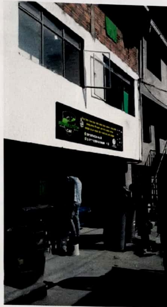
Foto No. 1 Fachada principal del predio ubicado en la dirección Carrera 10D No. 48A - 59.