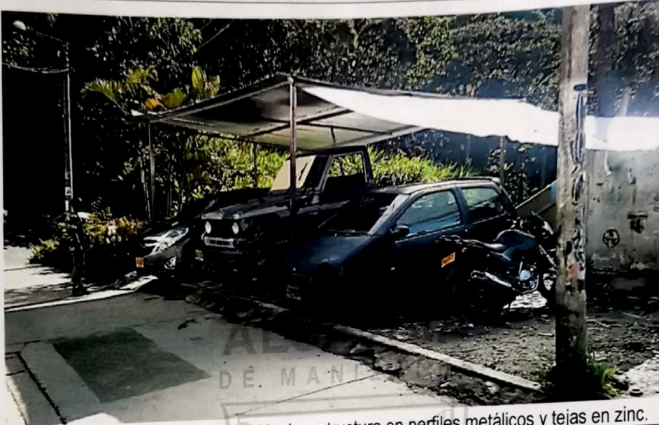
Foto No. 2 Ocupación sobre Zona Verde, estructura en perfiles metálicos y tejas en zinc.

SGM VC 0557-2021 Manizales, mayo 12 de 2021