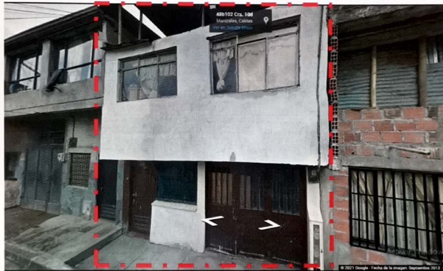
IMAGEN No2. Imagen tomada por Google Street View, septiembre 2013.