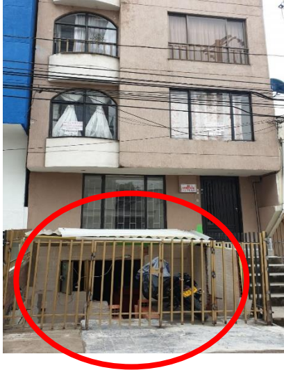
Foto No. 1 Fachada principal del edificio con dirección Carrera 11 # 9-43, Edif. Nariño. Se observan el cerramiento en reja metálica cubierto invadiendo el antejardín el antejardín.