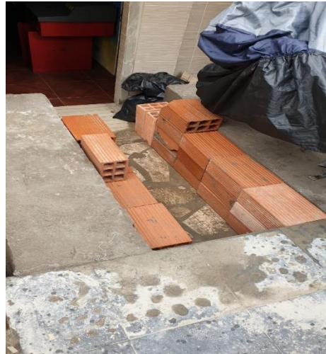
Foto No 2. Detalle de la construcción de la rampa, invadiendo el antejardín.