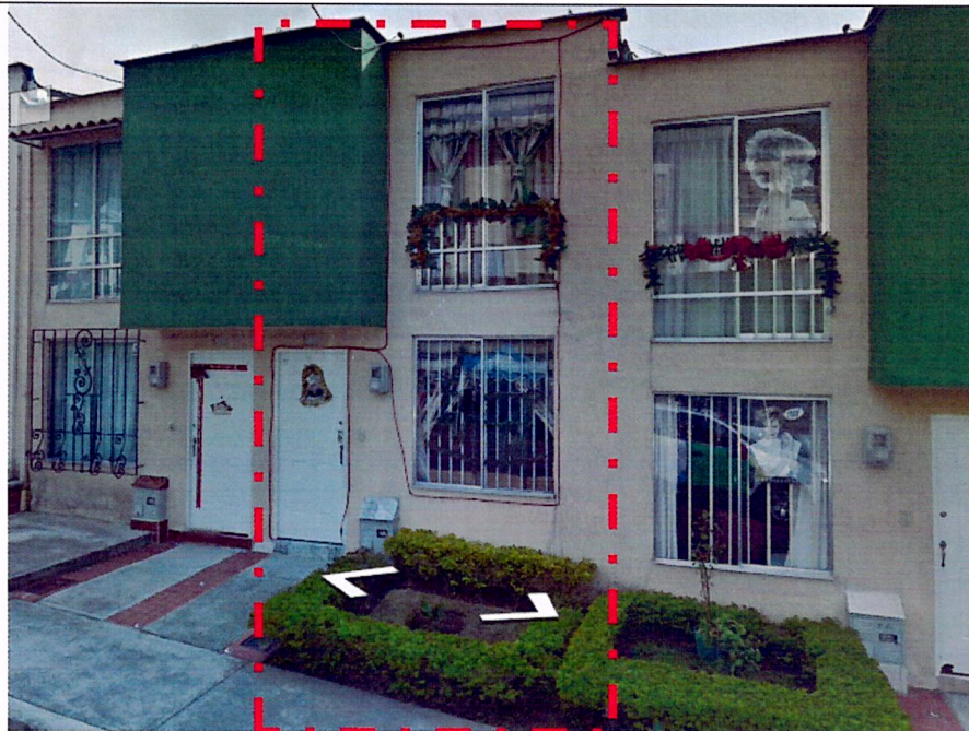
IMAGEN No 2. Imagen tomada por Google Street view, DICIEMBRE DE 2012, Dirección Carrera 3B No. 31B-50