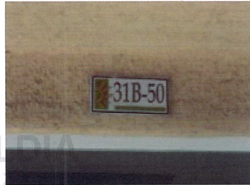
Fotografía No 2. Nomenclatura de la vivienda