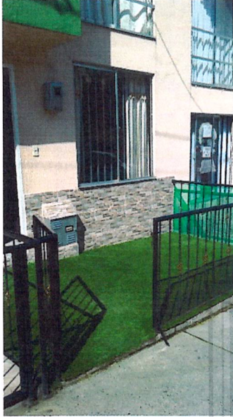
Fotografía No 1. Fachada actual de la vivienda, se observa reja metálica y losa de contrapiso en el antejardín

REGISTRO FOTOGRAFICO de la visita ocular realizada el día 10 de mayo del 2021 por parte del Equipo Técnico de Vigilancia y Control Urbanístico.