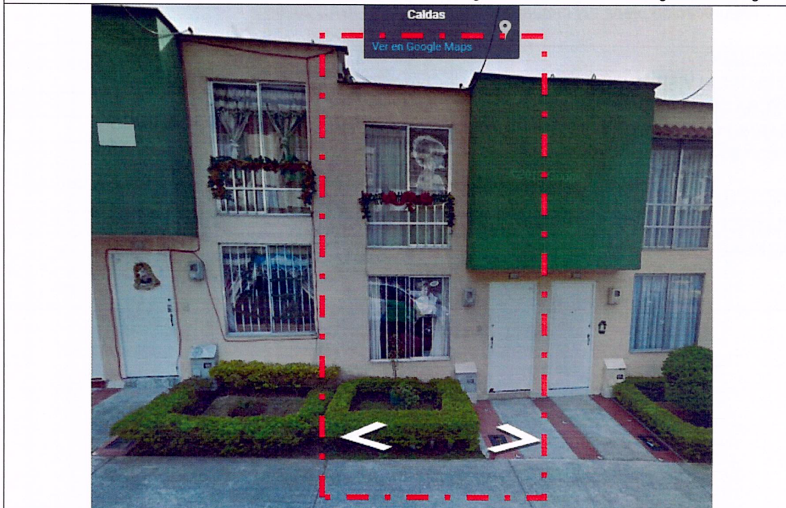
IMAGEN No 2. DICIEMBRE DE 2012, Dirección Carrera 3B No. 31B-46