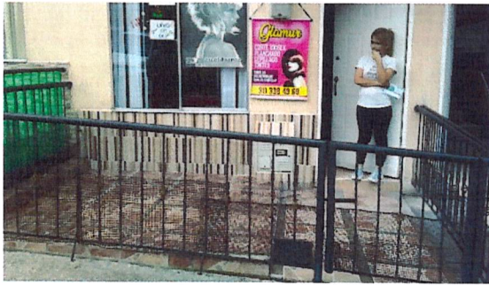
Fotografía No 1. Fachada actual de la vivienda, se observa reja metálica y losa de contrapiso en el antejardín