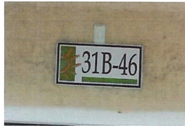
Fotografía No 2. Nomenclatura de la vivienda