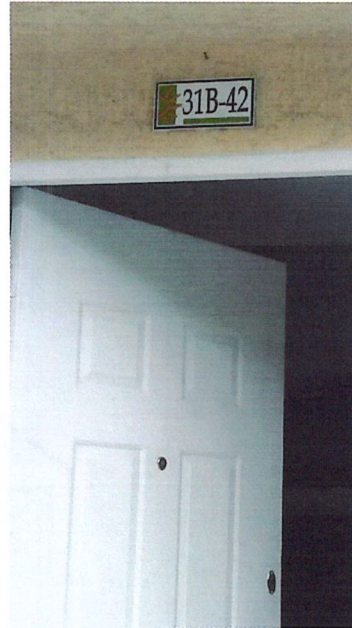
Fotografía No 2. Nomenclatura de la vivienda