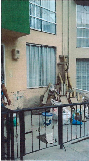
Fotografía No 1. Fachada actual de la vivienda, se observa reja metálica y losa de contrapiso en el antejardín