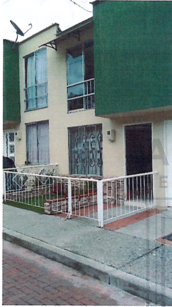
Fotografía No 1. Fachada actual de la vivienda, se observa reja metálica y losa de contrapiso en el antejardín

REGISTRO FOTOGRAFICO de la visita ocular realizada el día 10 de mayo del 2021 por parte del Equipo Técnico de Vigilancia y Control Urbanístico.