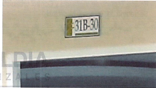
Fotografía No 2. Nomenclatura de la vivienda