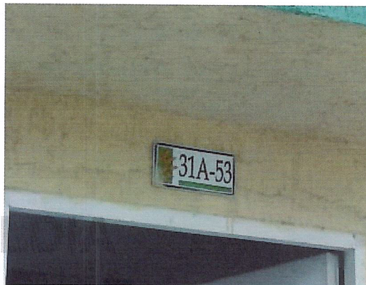
Fotografía No 2. Nomenclatura de la vivienda