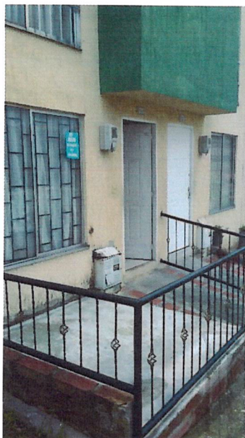
Fotografía No 1. Fachada actual de la vivienda, se observa reja metálica y losa de contrapiso en el antejardín

REGISTRO FOTOGRAFICO de la visita ocular realizada el día 10 de mayo del 2021 por parte del Equipo Técnico de Vigilancia y Control Urbanístico.