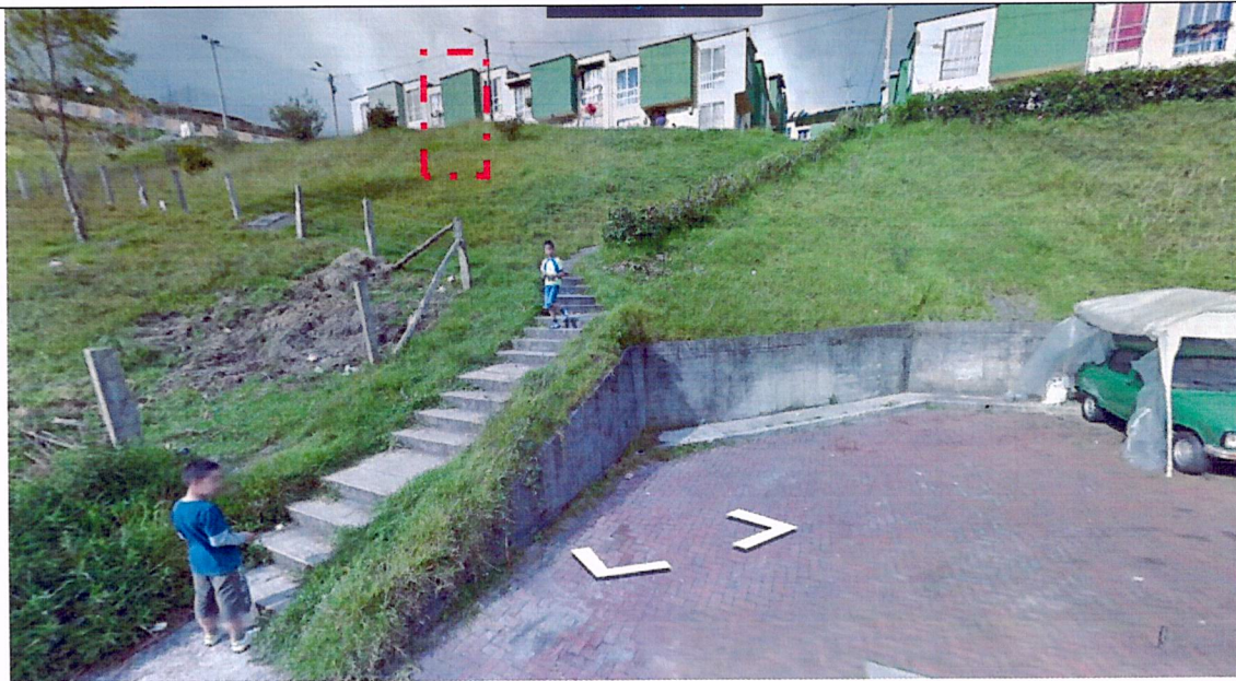
IMAGEN No 2. Imagen tomada por Google Street view, DICIEMBRE DE 2012, Dirección Carrera 3B No. 31A-53