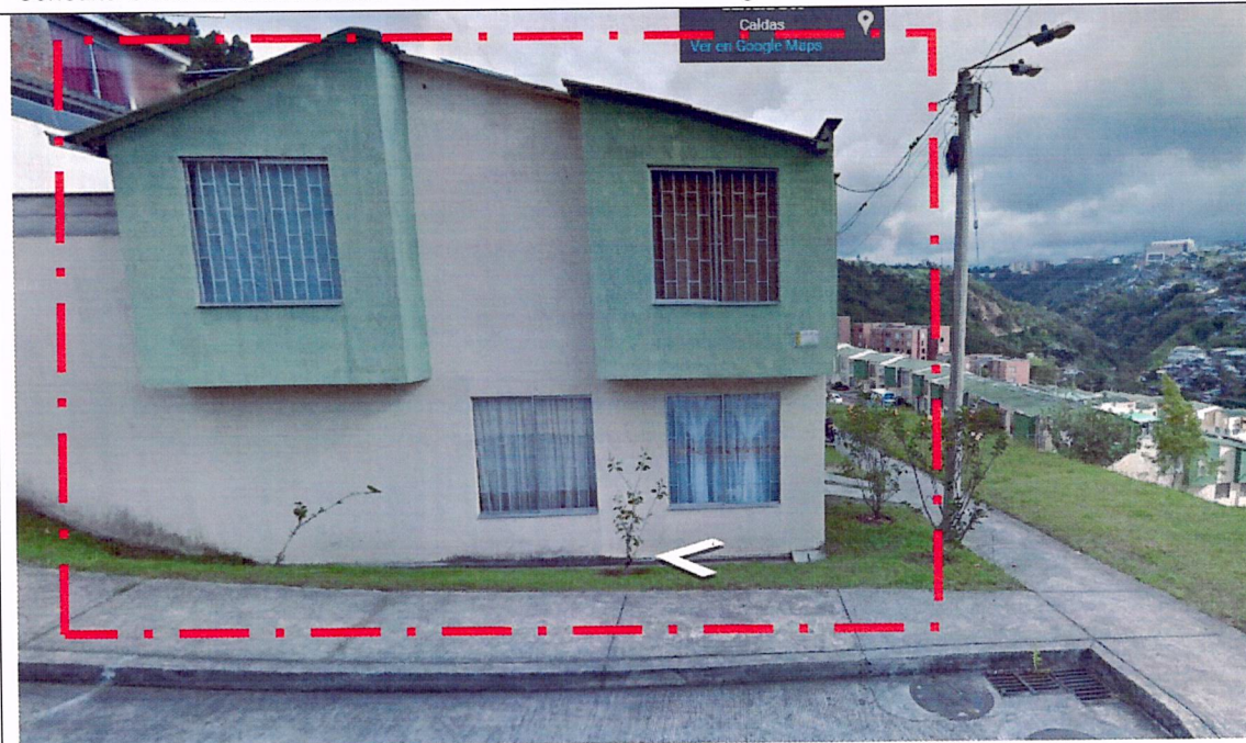
IMAGEN No 2. Imagen tomada por Google Street view, DICIEMBRE DE 2012, Dirección Carrera 3 B No. 31A-45