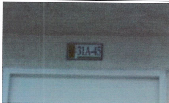
Fotografía No 2. Nomenclatura de la vivienda