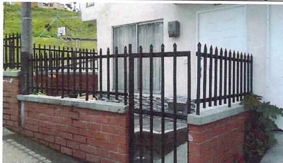
Fotografía No 1. Fachada actual de la vivienda, se observa reja metálica, murete y losa de contrapiso en el antejardín.

REGISTRO FOTOGRAFICO de la visita ocular realizada el día 10 de mayo del 2021 por parte del Equipo Técnico de Vigilancia y Control Urbanístico.