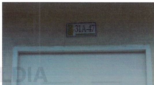
Fotografía No 2. Nomenclatura de la vivienda