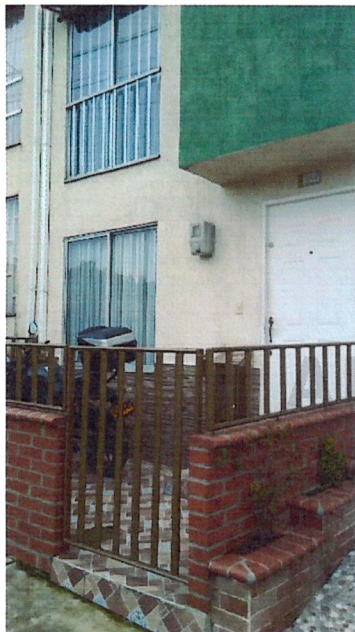
Fotografía No 1. Fachada actual de la vivienda, se observa reja metálica, murete y losa de contrapiso en el antejardín.

REGISTRO FOTOGRAFICO de la visita ocular realizada el día 10 de mayo del 2021 por parte del Equipo Técnico de Vigilancia y Control Urbanístico.