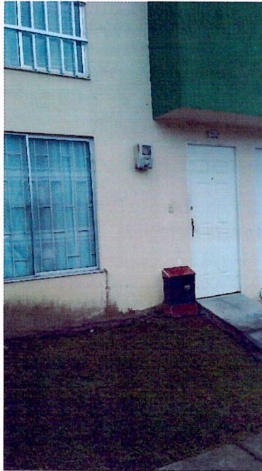
Fotografía No 1. Fachada actual de la vivienda, se observa un antejardín sin modificación alguna.

REGISTRO FOTOGRAFICO de la visita ocular realizada el día 10 de mayo del 2021 por parte del Equipo Técnico de Vigilancia y Control Urbanístico.