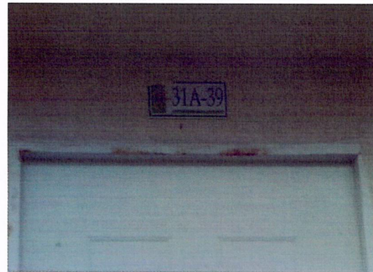
Fotografía No 2. Nomenclatura de la vivienda