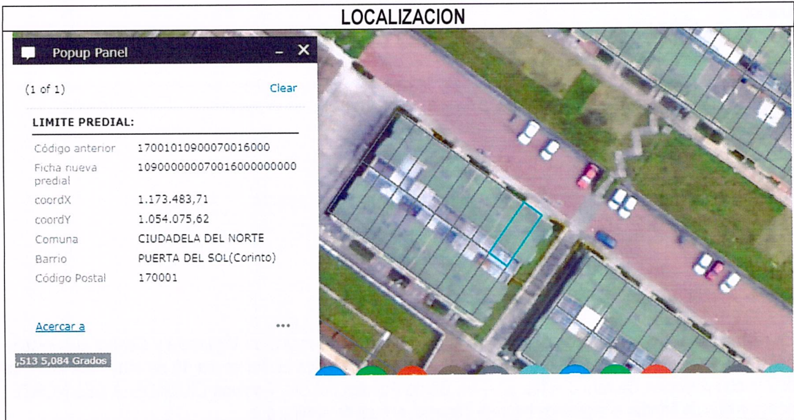
IMAGEN No 1. Barrio Puertas del Sol, Comuna CIUDADELA DEL NORTE. Imagen cartográfica. Consulta Sistema Estructurante - Sistema de Información Geográfica – SIG.