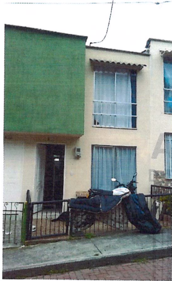
Fotografía No 1. Fachada actual de la vivienda, se observa reja metálica y losa de contrapiso en el antejardín.