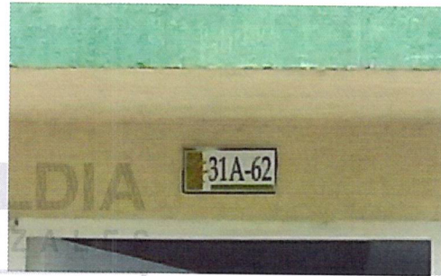
Fotografía No 2. Nomenclatura de la vivienda