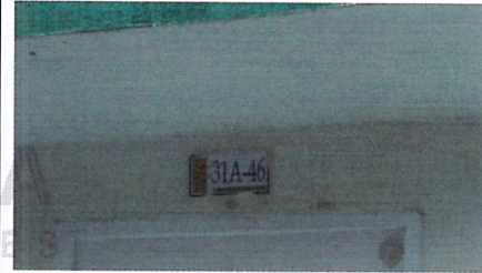
Fotografía No 2. Nomenclatura de la vivienda