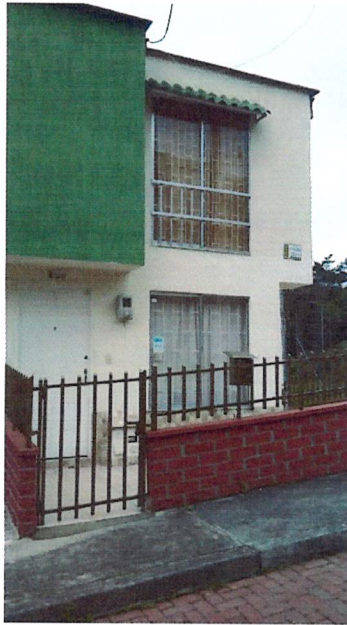
Fotografía No 1. Fachadas actuales de la vivienda, se observa murete y reja metálica.

REGISTRO FOTOGRAFICO de la visita ocular realizada el día 10 de mayo del 2021 por parte del Equipo Técnico de Vigilancia y Control Urbanístico.