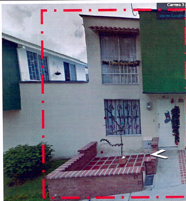
IMAGEN No 2. DICIEMBRE DE 2012, Dirección Carrera 3 A No. 31B-38