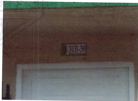
Fotografía No 2. Nomenclatura de la vivienda