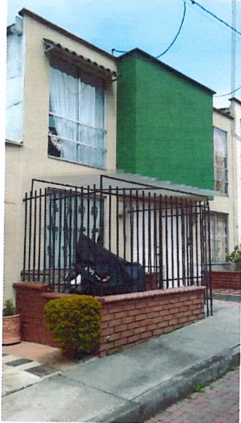
Fotografía No 1. Fachada actual de la vivienda, se observa la reja metálica y su cubierta traslúcida instalados.

REGISTRO FOTOGRAFICO de la visita ocular realizada el día 10 de mayo del 2021 por parte del Equipo Técnico de Vigilancia y Control Urbanístico.