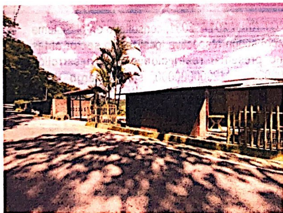
Foto No. 1 Fachada de la construcción.