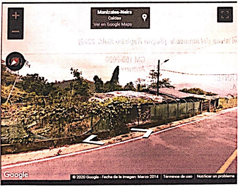
Vista fachada principal, de vivienda preexistente en predio en cuestión, Corregimiento El Manantial sector La Balastreira, antes de llegar a la Vereda El Águila.