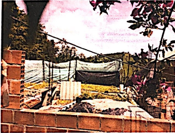
Foto No. 3 Levantamiento de vigas y columnas en concreto reforzado y mampostería.