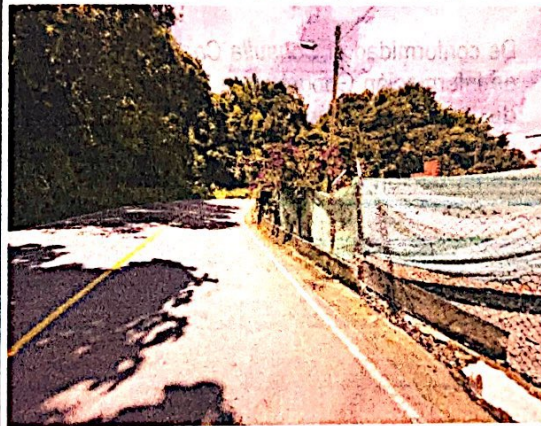
Foto No. 2 Lugar de la intervención.