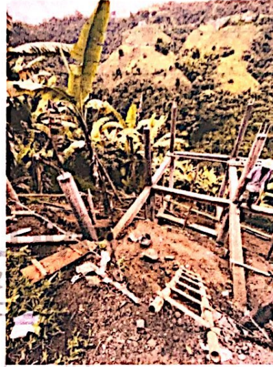
Personal adelantando labores de construcción.