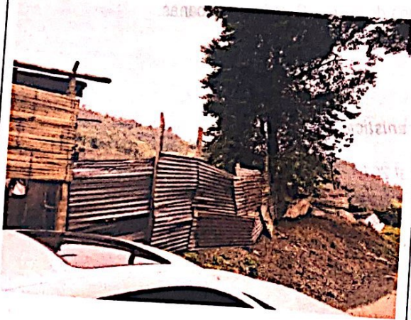
Foto No. 1 Fachada de la construcción.