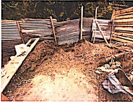
Foto No. 3 Material de construcción.

SGM VC 0167-2020 Manizales, abril 07 de 2020