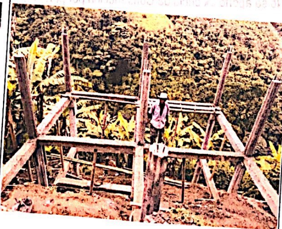
Foto No. 2 Levantamiento de vigas y columnas en concreto reforzado.