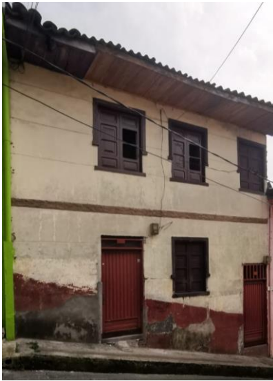
Foto No. 1 Fachada del predio ubicado en la dirección Carrera 15 No. 107 – 33/37.