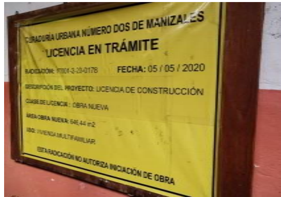
Foto No. 2 Licencia en Trámite radicado No. 17001-2-20-0178 del 5 de mayo de 2020.