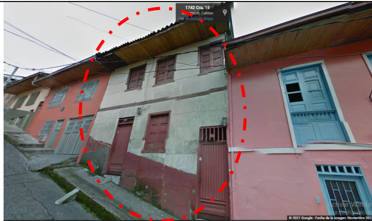
IMAGEN No2. Imagen tomada por Google Street View, noviembre 2012.