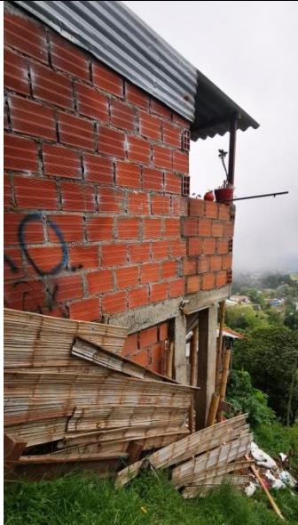
Foto No. 1 Vivienda localizada en la parte posterior de la dirección Calle 9B 49 Casa detrás del Niño Jesús de Praga.