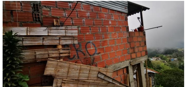
Foto No. 2 No se evidencia que se adelanten labores constructivas.