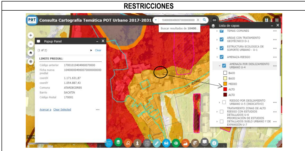
IMAGEN No3. Barrio Sacatín, Comuna Atardeceres. Imagen cartográfica. Consulta Sistema Estructurante - Sistema de Información Geográfica – SIG. SI presenta restricción para desarrollo urbanístico, ya que el predio se encuentra dentro de ZONAS AMENAZA POR DESLIZAMIENTO URBANO U-4 MEDIO Y ALTO.