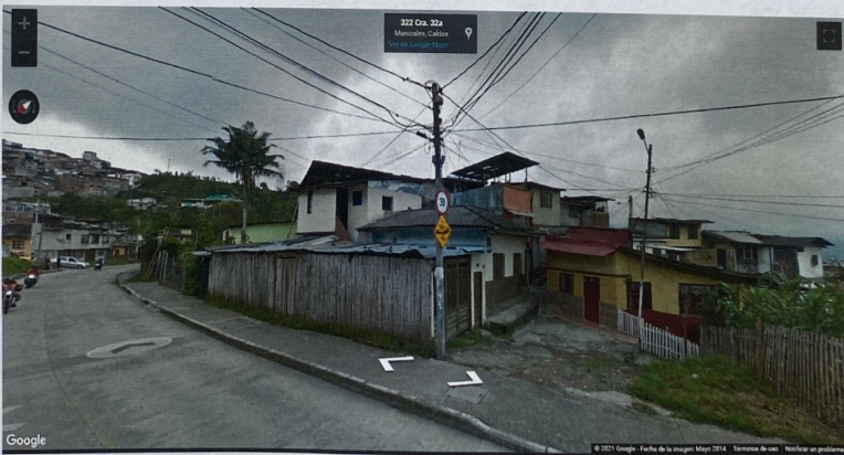
IMAGEN No 2. Imagen tomada por Google Street View, mayo de 2014, Dirección Calle 31A # 32A-09.

ALCALDÍA DE MANIZALES Calle 19 N° 21-44 Propiedad Horizontal CAM Teléfono 887 97 00 ext.71500 – Código postal 170001 – Atención al Cliente 018000 968988 www.manizales.gov.co