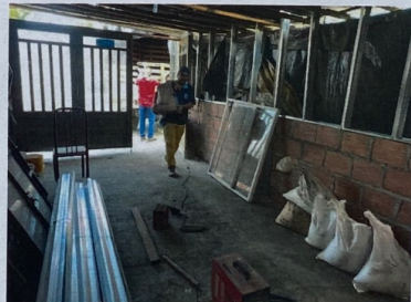
Foto No 2. Cerramiento de la vivienda en mampostería y sistema drywall, además personal laborando en la obra. también se detalla la losa de piso en concreto.