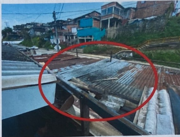
Foto No. 4. Estructura metálica para adecuar la cubierta.