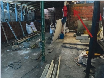
Foto No. 3 Construcción de muros perimetrales, con estructura en concreto y ladrillo farol.

SGM VC 0472-2021 Manizales, abril 27 de 2021