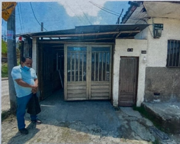
Foto No. 1 Fachada de la vivienda, ubicada en Calle 31A # 32A-09., barrio Bajo Cervantes.