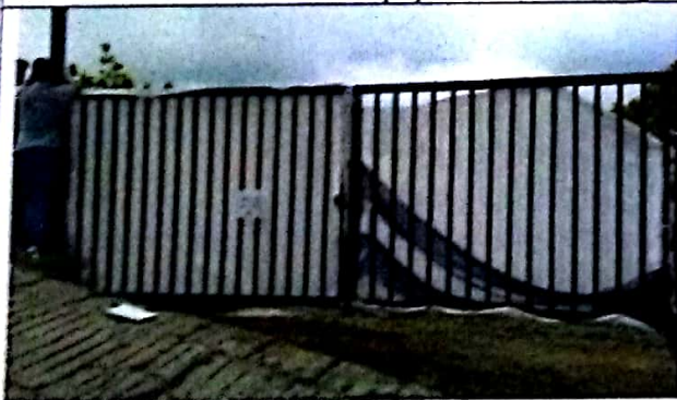
Fotografía No 1. Cerramiento del lote

REGISTRO FOTOGRAFICO de la visita ocular realizada el día 28 de octubre del 2020 por parte del Equipo Técnico de Vigilancia y Control Urbanístico.