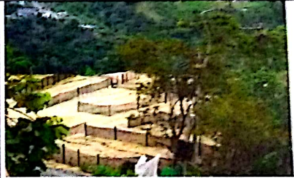
Fotografía No 2. Estado del lote el día de la visita