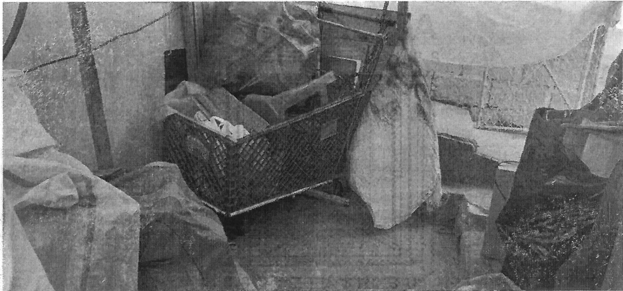
Imagen 2 Material reciclado almacenado en la parte delantera de la propiedad