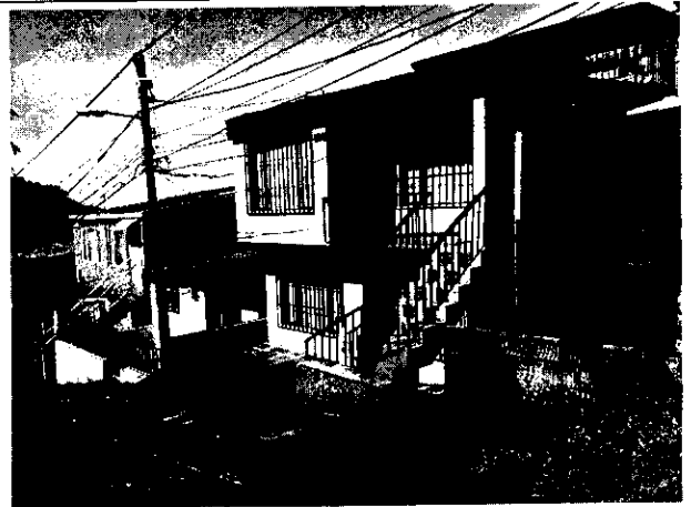
Foto No.2 Fachada actual de inmueble visitado.