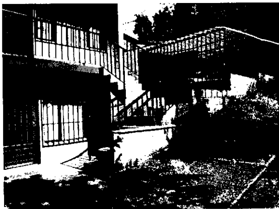
Foto No 4. Escalera sobre antejardín, Carrera 33A No 48A 16, Bajo Prado.