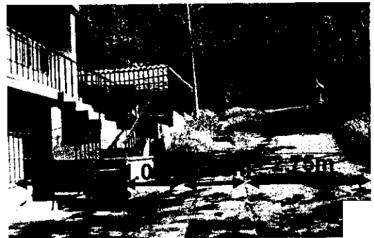
Foto No 5. Perfil vial tomado en sitio. Antejardín: 2.60m, zona equipamiento: 1.00m, andén: 1.00m, Calzada: 2.75m.