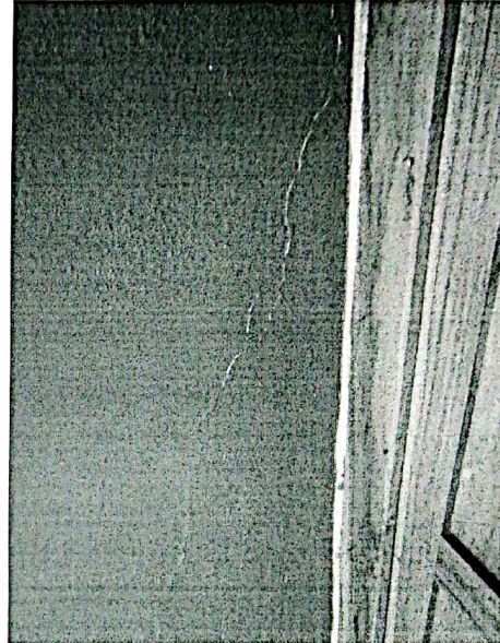
Foto2. Vista general de las fisuras.